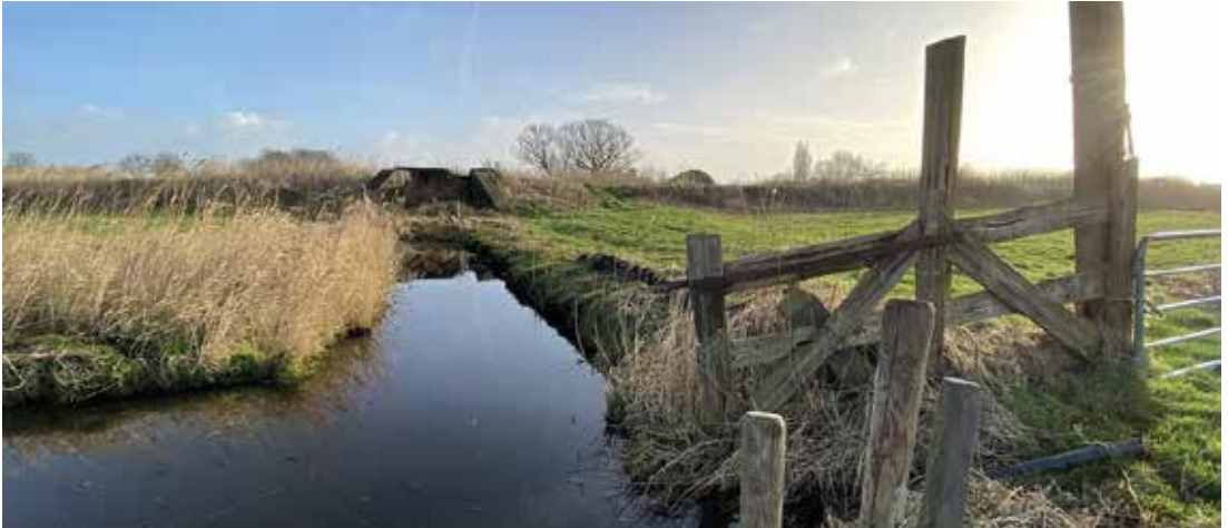
Deel van de waterinlaat van de Hollandse Waterlinie

Uit de nieuwsbrief van de gemeente van 25 januari 2023