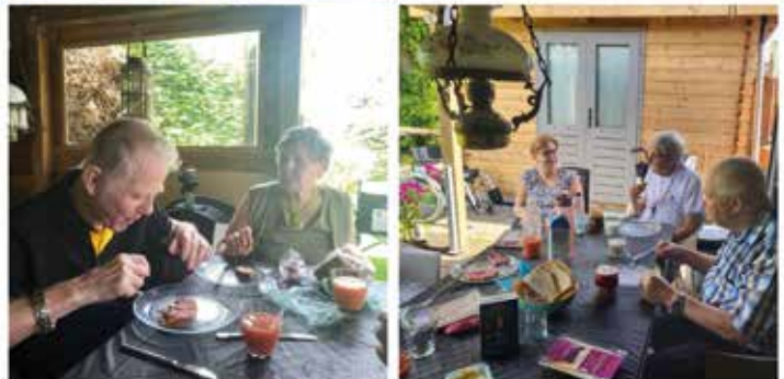
Bewoners van woonzorgcentrum Breezicht genieten van een dagje op ATV Ons Buiten