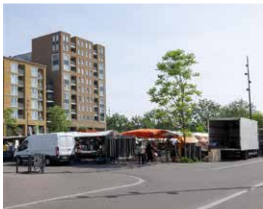
Het winkelcentrum.